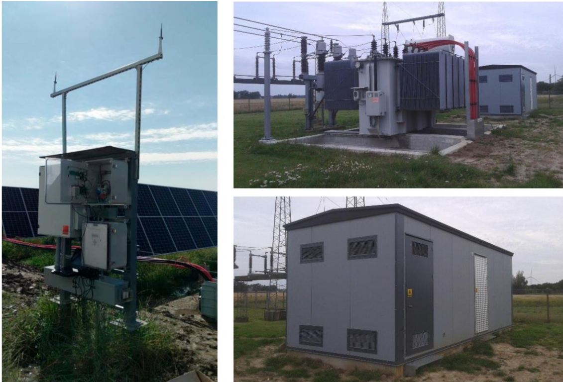
Figur 2 Eksempel på vejrstation (venstre), transformer (højre øverst) og hjælpeanlæg/maskinhus (højre nederst).