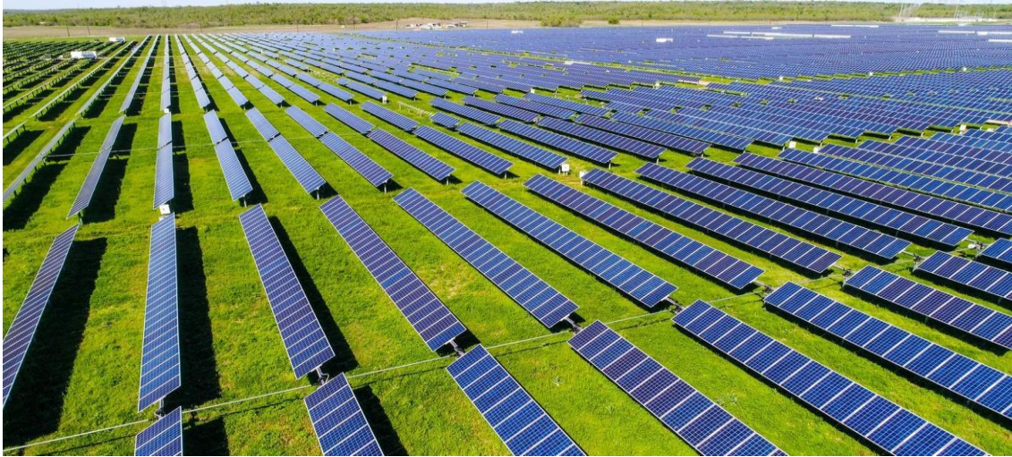
Figur 6: Solcellepaneler på mark i høj sol.

anvender trackersystemer, vil panelerne altid være vinklet mod solen, hvilket derfor ikke giver genskinsgener ved jordoverfladeniveau.