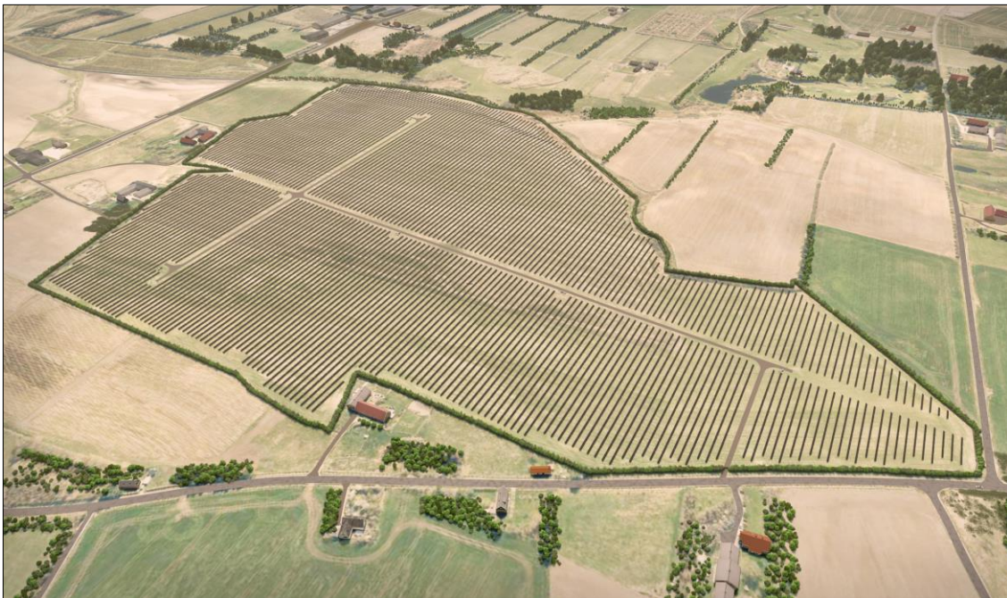
Figur 1: Principskitse på opbygning af en solcellepark med solpaneler, servicevej og randbeplantning.

Solcelleanlægget forventes etableret som et samlet anlæg, men kan i enkelte tilfælde blive opdelt i mindre anlæg såfremt det er krævet af distributions- eller transmissionsnettets eksisterende kapacitet. Solpanelerne opstilles som udgangspunkt i nord-syd gående lige og parallelle rækker med samme indbyrdes afstand på 6 - 7 meter (figur 1). Panelerne har samme indbyrdes højde på 2,5 - 3,5 meter over terræn. Mindre terrænspring og ujævnheder søges optaget i panelerne, så anlægget opleves som en ensartede flade. Transformere og teknikbygninger forventes opført i op til 4 meter over terræn (figur 2). Hvis der af tilslutningsmæssige grunde skal anvendes særligt store transformere, kan disse normalvis være omkring 7 - 8 meter i højden. Lynafleder ved transformere vil bestå af en metalmast der typisk er ca. 3 - 4 m højere end selve transformeren. Til service og vedligehold af anlægget etableres et antal interne serviceveje så teknikere, reparatører, gartnere mv. kan komme uhindret rundt i området.