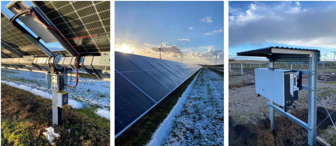
Figur 4: Eksempel på SAT-montagesystem med "Bi-facial" solcellemoduler og tilhørende inverter (billede yderst til højre).

solindstråling til panelerne opstilles systemet i rækker som løber fra syd til nord. Solcelleparkens anlægsdesign tilsikrer altid bedst mulig tilpasning af SAT-systemet til de faktiske forhold i området, såsom naturlige grænser, jordbundsforhold, terræn, ejendomsgrænser mv.